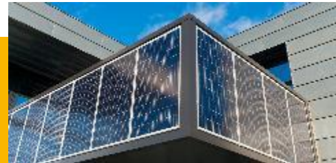
Dach- und Fassadenanlagen VSU bis 1 Mio. EUR