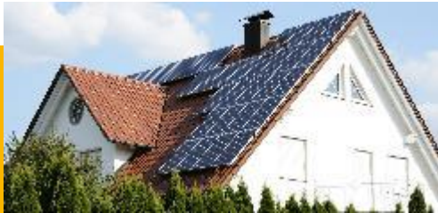
Dach- und Fassadenanlagen bis 10 kWp (Kleinanlagen)

Decken Sie dieses Risiko bestens mit der Allianz ESA Photovoltaik Versicherung für Ihre Kunden ab.