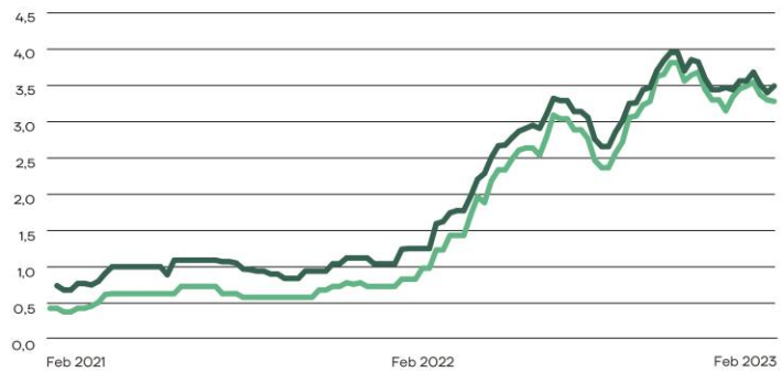
EZB- und Fed-Leitzins in Prozent

Quellen: Dr. Klein Privatkunden AG, Europace AG