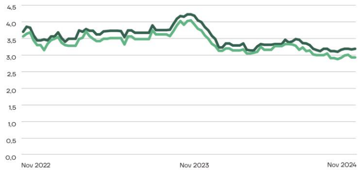
EZB- und Fed-Leitzins in Prozent

Quellen: Dr. Klein Privatkunden AG, Europace AG