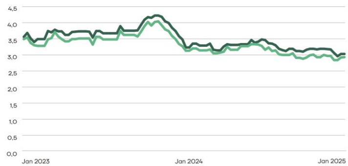
EZB- und Fed-Leitzins in Prozent

Quellen: Dr. Klein Privatkunden AG, Europace AG